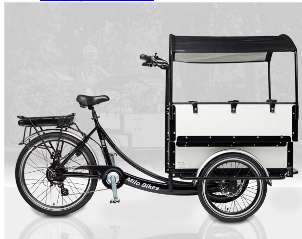
Solsejl er standard