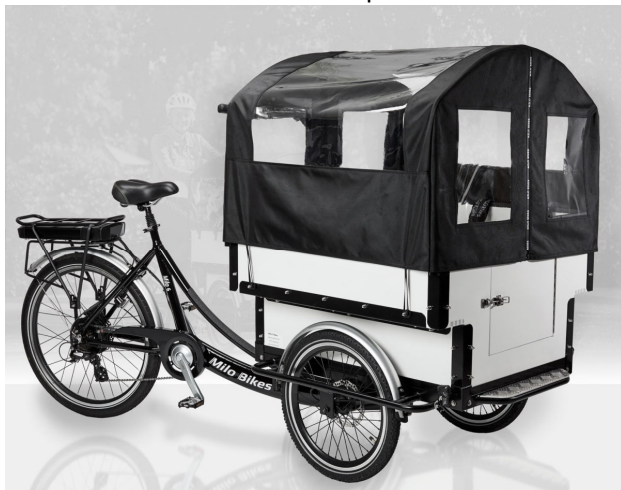
Kaleche er standard