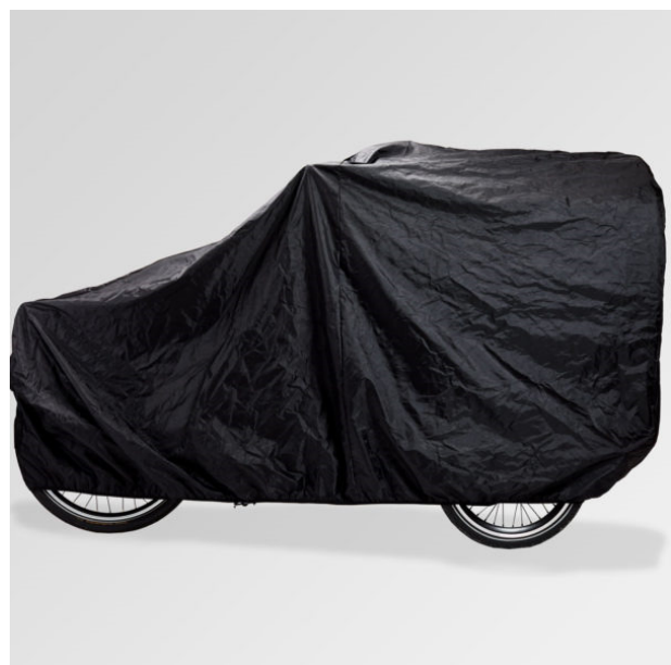
Parkeringsovertræk er standard